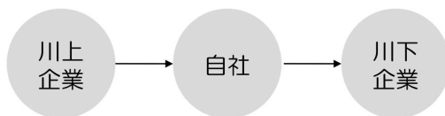
バリューチェーン型